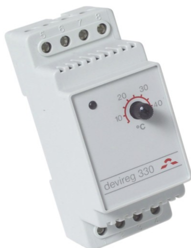
Рис. 1. Электронный терморегулятор devireg™ 330 .

Универсальный электронный терморегулятор devireg™ 330 (рис. 1) применяется для управления электрическими кабельными системами обогрева (КСО) различного назначения (табл. 1). Может также быть использован для управления другими системами электроотопления или системами отопления с электрическими блоками контроля.